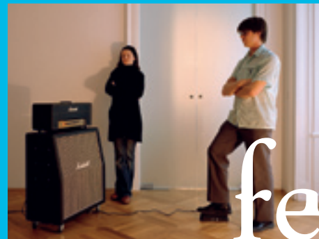
Feedback, 2004 Collaboration with George Bures Miller T-B A21 Collection