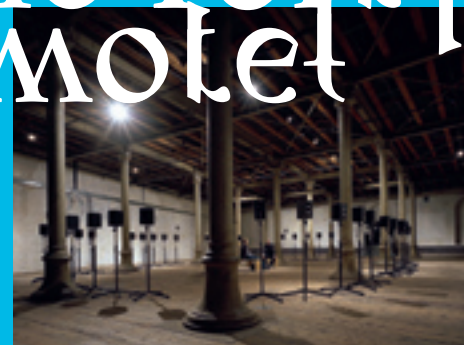
The Forty Part Motet, 2001 Installation view Atelierhaus der Akademie der bildenden Künste Wien (Semperdepot)