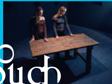
To Touch, 1993/94 T-B A21 Collection